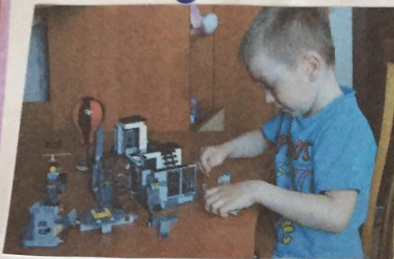
Я люблю играть в Лего, необычные создавать, целый город, новый транспорт ..