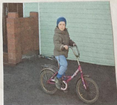
Велосипед и самокат обожает.