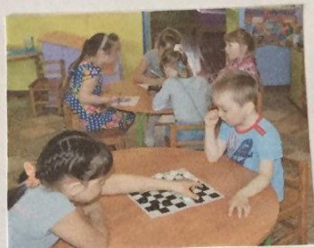
В шашки ловко я играю.